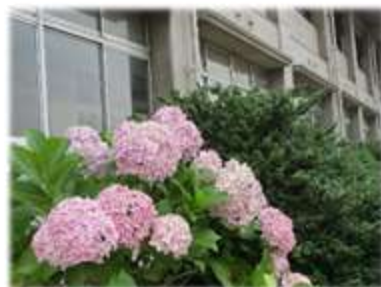
〔豆知識〕アジサイの花に見える部分は 花卉ではなく、がくが変化したものです。

今日から7月。梅雨も後半ですが、もうしばらく雨の多い天気が続きそうです。特別棟入り口のアジサイは、元気に花を咲かせています。今年度は、夏休みが短縮され、1学期はあと1か月あります。暑さに負けず、感染症対策・熱中症予防に気をつけながら、元気に過ごしましょう。