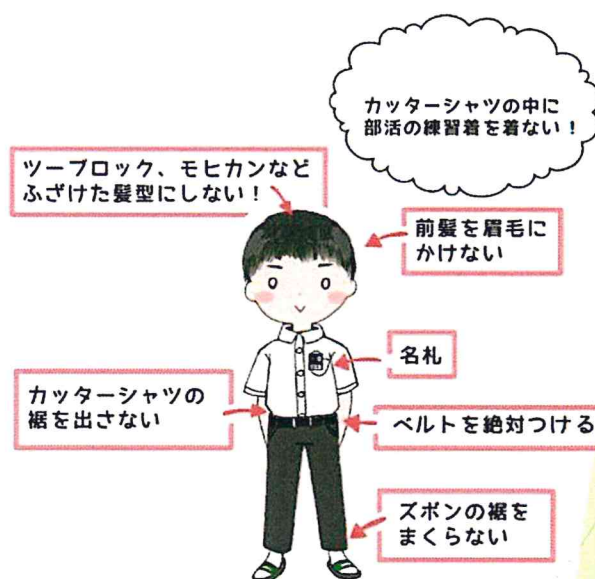
～男子の正しい服装～