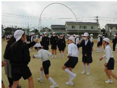
2月10日 校内長縄大会

給食試食会には35の方が来てくださいました。「給食も結構おいしいなあ」という声も聞かれました。皆さんにご協力いただき、給食も残らずいただくことができました。今後も、こうした機会をもちたいと思います。