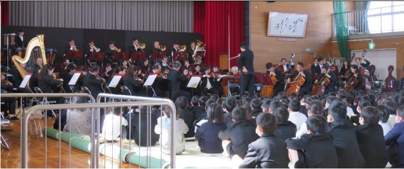
1月20日 オーケストラ演奏会

オーケストラの生演奏を聴くことは滅多にないと思いますが、船穂小学校体育館の、すぐ目の前で聴けるとなると感動もひとしおです。船穂小と柳井原小の児童も楽器の多さに圧倒され、そして音楽にすっかり魅了されました。保護者・地域の方も75名も来ていただきました。