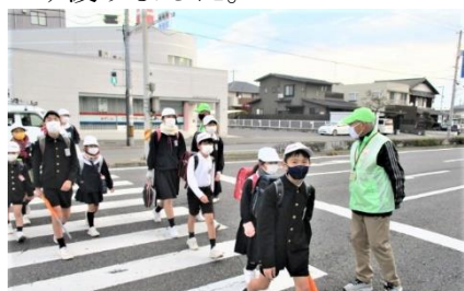
パトロール隊の方と「あいさつ」

12月24日（木）、第2学期の終業式の校長の話として、「あかさき」の合言葉「あいさつする子」「かんしゃする子」「ささえあう子」「きまりをまもる子」についての振り返りをしました。「あいさつ」については、登校中の旗当番の方や見守り隊の方への挨拶が良くなってきた人もいますが、まだできていない人もいますので3学期はもっと頑張ろうと呼びかけました。このことについては、12月の地区別児童朝礼でも話をしました。「かんしゃ」については、給食