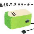
黒箱ふきクリーナー