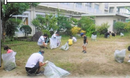
学校クリーン作戦 (8/20・土)

8/20(土)に、PTA行事として、子どもたち、保護者・地域の皆様のお力をかりて、運動場、中庭、歩道沿いの植込み等の草抜きや清掃を行いました。早朝の作業にも関わらず、たくさんの方々のご参加をいただき、本当にありがとうございました。