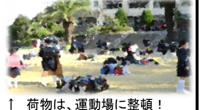
↑ 荷物は、運動場に整頓!