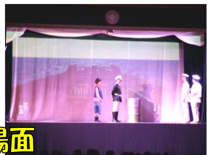
【海底2万マイル】の一場面