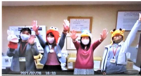
先生方からのビデオメッセージ