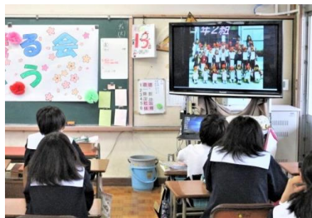
出し物のビデオや思い出のスライド