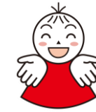
多津美中学校区人権啓発キャラクター「ころ」

今年度は多方面で様々なイベントが再開されています。多津美中学校区内においても、恒例となる地域の各行事が開催され、多くの参加者で賑わいました。多津美中学校区人権学習推進委員会の啓発キャラクター「ころ」も皆さんと一緒に楽しい時を過ごしました。