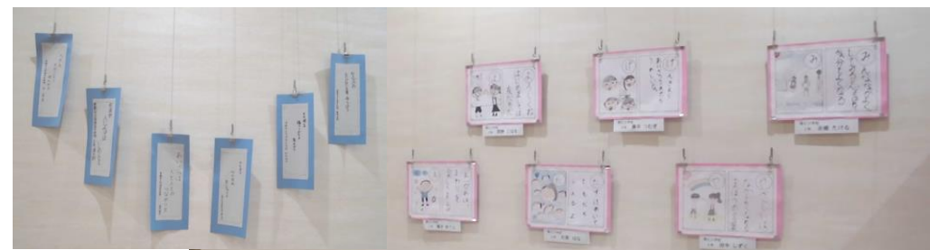
くらしきすこやかプラザ (有城荘・倉敷児童館)