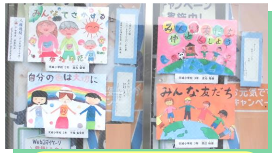
JA 晴れの国岡山 藤戸支店

多津美中学校区内の8事業所で、学区内の小学生・中学生が描いた人権ポスターや人権カルタ、人権標語を展示しました。どの作品も、訪れた人々の心に響くようなメッセージが込められていました。ご協力して下さった皆さん、素敵な作品をありがとうございました。