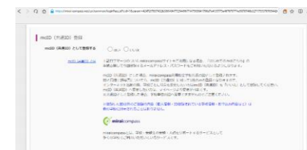
⑥さらに下へ移動 共通IDとして登録しておく 便利です