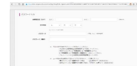
⑤④のページの下に移動 PWを設定