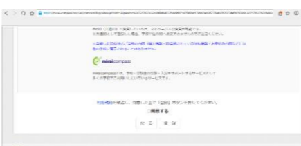
⑦利用規約を確認し、同意するに☑した後に