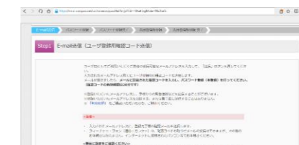
③メールアドレスを仮登録