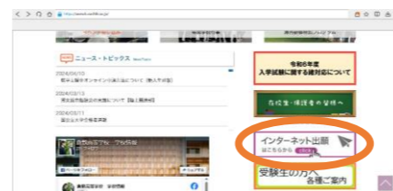
①高校 HP のトップページ

※ 現在のところオープンスクールの申し込みは始まっていませんが、メールアドレスの登録やパスワードの設定はできるようです。以下の画像は、倉敷高校のホームページの関係部分を切り取ったものです。参考にしてください。