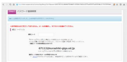
④送られてきた確認コードを入力