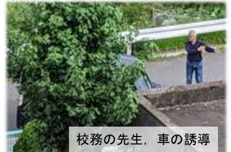
校務の先生、車の誘導

各教室では、学級担任がボードや黒板にメッセージを記したり、密を避け、スムーズに課題の受け渡しができるよう、廊下や教室の椅子や机の配置を工夫したりしていました。スタートの朝8時前には誘導も始まりました。