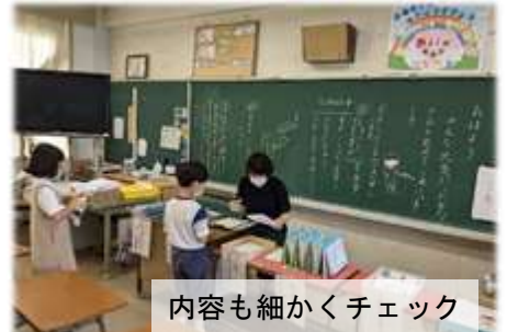
内容も細かくチェック