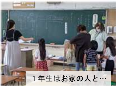
1年生はお家の人と…

各教室では、学級担任がボードや黒板にメッセージを記したり、密を避け、スムーズに課題の受け渡しができるよう、廊下や教室の椅子や机の配置を工夫したりしていました。スタートの朝8時前には誘導も始まりました。