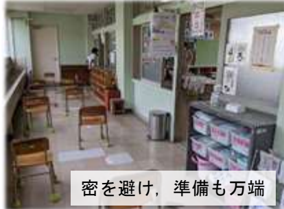
密を避け、準備も万端