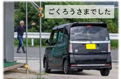
ごくろうさまでした

教室の黒板には担任からの「励ましの言葉」が…。教育もICTの時代ではありますが、やはり、黒板には、どこかしら温かみがあり、「不易」を感じます。たくさんの車が並びましたが、校務の先生の誘導で「また9月…」。