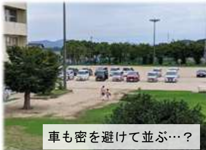
車も密を避けて並ぶ…？