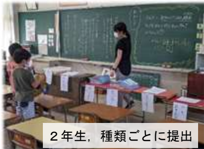
2年生、種類ごとに提出