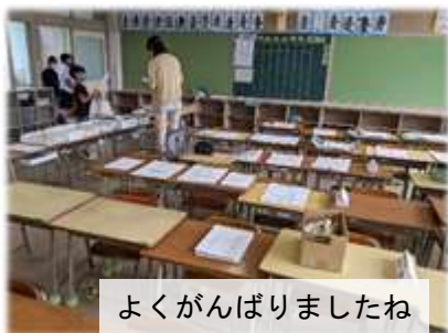
よくがんばりましたね