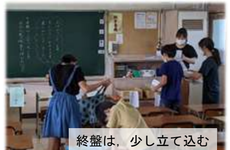
終盤は、少し立て込む

担任は、課題を預かるとともに、内容も細かくチェックしていました。その時間は短いものでしたが、児童と担任との久しぶりのやりとり、対話のひとつときであり、その温かい姿には微笑ましいものさえ感じられました。