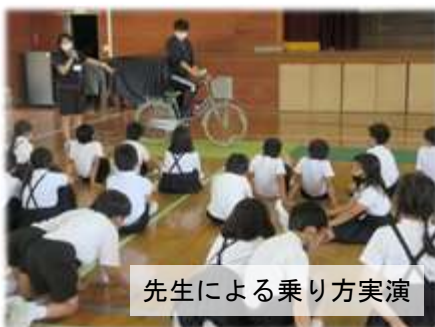
先生による乗り方実演

4年生は、自転車の安全な乗り方を学びました。先生による実演から見通しをもった児童は、自転車に乗っている自分を想定し、各自が「エア」で、安全確認の在り方、ブレーキの使い方等を疑似体験を通し学びました。生卵を用いたヘルメットの効能実験、「生活実践してなんぼ」を確認した「振り返り」等も有意義なものでした。