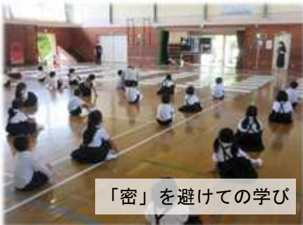
「密」を避けての学び