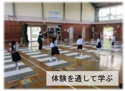
体験を通して学ぶ