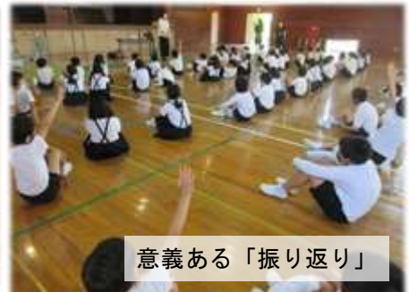
意義ある「振り返り」