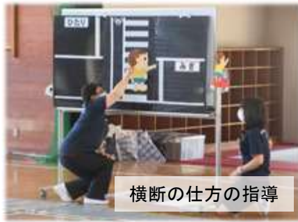
横断の仕方の指導