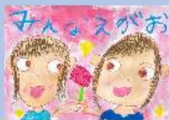
苗小 2年 原 彩乃