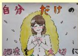
岡田小 6年 溝口 はな