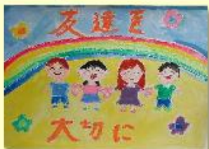
川辺小 4年 川辺 由奈