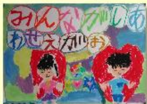
川辺小 2年 川辺 晃大