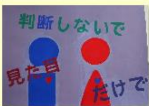
真備東中 2年 早岡 由衣