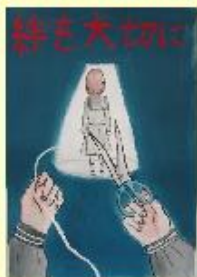
真備東中 2年 森定 結音