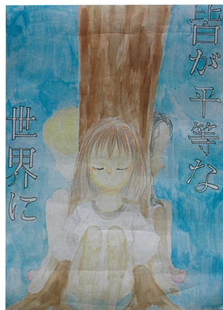
連南中2年 吉原 妃愛