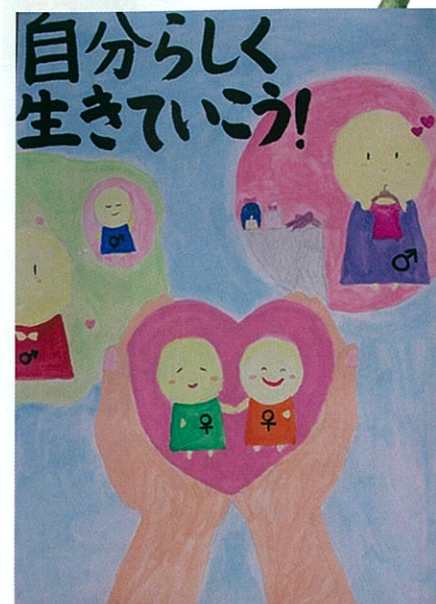
連南中2年 川崎 明星