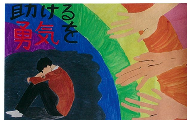
連南中2年 坪井 佑介