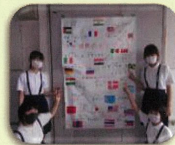
ありがとうキャンペーン

田植えをはじめ、稲刈り、もちつきなど、さまざまな行事で地域の方が大勢ボランティアとして参加し、子どもたちの活動を支えてくださっていることも本校の大きな特色です。地域の方とのつながりの中で、子どもたちが心豊かに育っていることに感謝しています。