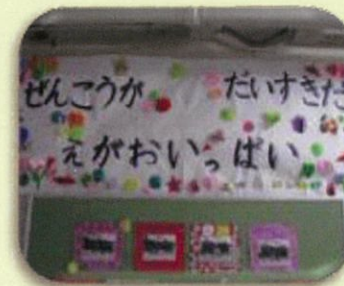
～人権月間～ スローガンとクラスのめあて