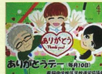
東陽中学校の美術部が制作した「ありがとうデー」のイラスト