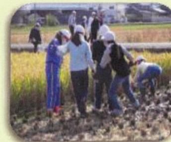
地域ボランティアの方との 稲刈り体験