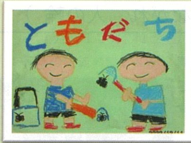
二万小 1年 赤木 悠隼