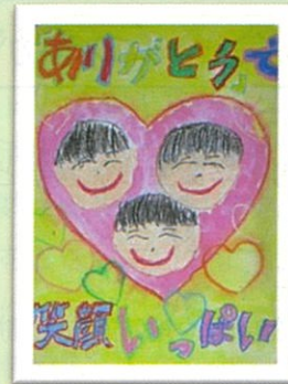
二万小 5年 浅野 隼都