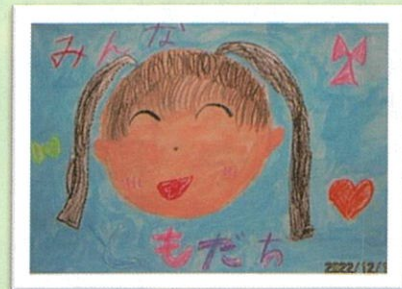
呉妹小 1年 三宅 彩優