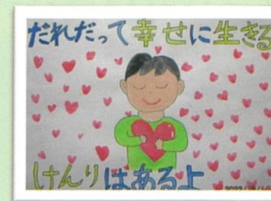
呉妹小 4年 増成 美歩乃