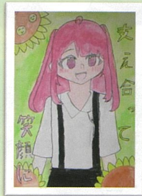
箭田小 6年 守屋 香穂