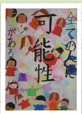
真備中 2年 長尾 みなみ