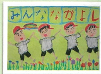
箭田小 1年 山本 珀翔