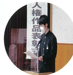
▲ 作品に込められた「思い」の発表