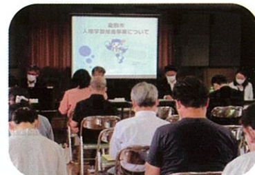
▲ 今年度の総会の様子

6月5日(日)、令和4年度西中学校区人権学習推進委員会総会を倉敷西公民館で開催しました。一昨年と昨年は、新型コロナウイルス感染症拡大防止のため、対面での総会中止し、書面による表決という形をとりました。しかし今年度は、感染対策を徹底し、推進委員、教育委員会関係者など38名の参加を得て、2年ぶりに対面による総会を開催することができました。