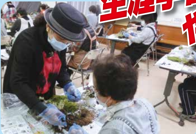
簡単!かわいい!お正月コケ玉 下津井公民館