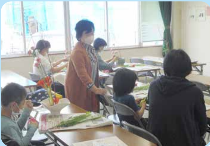
子どもの生け花 庄公民館

発行 倉敷市生涯学習推進本部 編集 倉敷市教育委員会 ライフパーク倉敷市民学習センター TEL(086)454-0011 FAX(086)454-0305