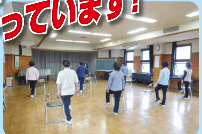
元気ハツラツ!健康体操 玉島黒崎公民館