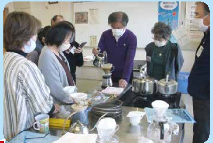
美味しい一杯ありますスペシャル珈琲講座 連島南公民館