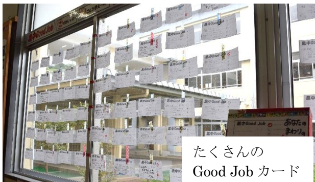
たくさんの Good Job カード