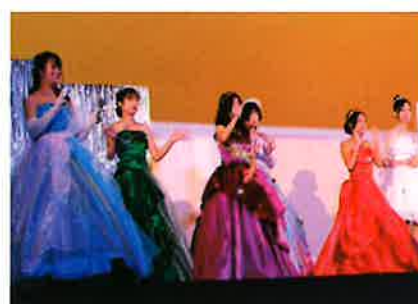
翔南祭ファッションショー