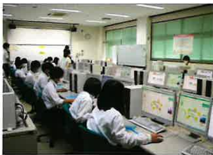
オープンスクール