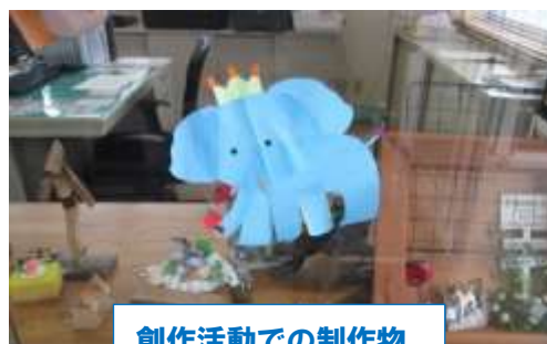
創作活動での制作物

「生きる」をテーマに基礎生活力を高めて、社会に出ても自分に負けず生活ができるように、精神面でのサポートを行います。また、やりたいことを一緒に見つけ、なりたい自分を一緒に考え、夢や希望をもって自分らしく生活できるようにサポートする事業所です。(同施設案内より)