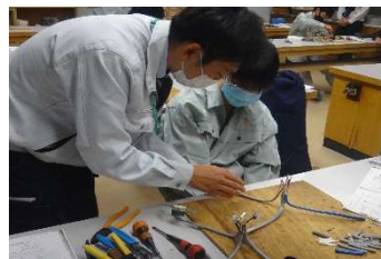
出前授業（電気科）の様子