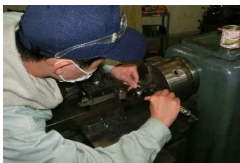
機械科の実習風景