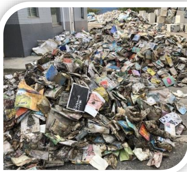
廃棄となった図書