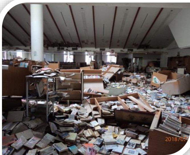
浸水被害直後の真備図書館

現在、多くの方々の支援をいただきながら真備町は復興に向け一步一步進んでいます。市民の学びの場であり、憩いの場でもある真備図書館についても令和2年度中の再開館を目指し全力で取り組んでおります。