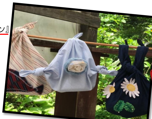
『包んで結ぶ』 ふるしきエコバッグ』 イメージ