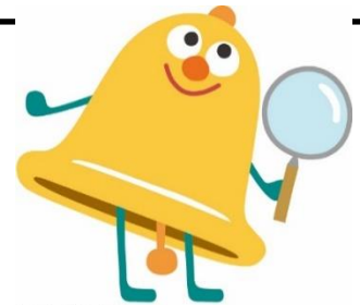
シラベルくん

くらしき こじま たましま みずしま ふなお まび ぶんか れきし さんぎょう 倉敷・児島・玉島・水島・船穂・真備の文化、歴史や産業について、 ほん しら ちいき ひと しゅざい けんきゅうさくひん 本で調べたり、地域の人に取材したりして、研究作品にしよう。 し くらしきし みりょく はっけん 知らなかった倉敷市の魅力を発見できるかも!