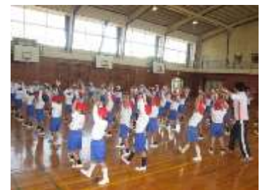
練習の様子（1・2年生）

また、保護者の方には、お子様の運動会の話をしっかり聴いて、励ましていただければ幸いです。よろしくお願いいたします。