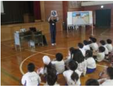
交通安全教室の様子（3・4年生）

5月8日（水）児島支所から2名の指導員の方をお招きして、交通安全教室を行いました。交通安全教室のめあては、「正しい歩行の仕方や自転車の正しい乗り方を理解して、自分で実践することができるようにする。」です。指導員の方が、スライドや自転車を使って分かりやすい説明をしてくださり、子ども達は、交通安全に対する意識を高めることができました。