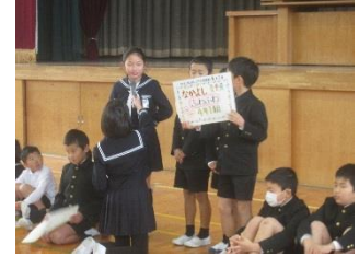
学級のめあての発表

大切なことは、この取り組みを人権週間だけでなく、今後も続けていくことだと思います。なかよし集会で発表した学級のめあて(合い言葉)を紹介します。