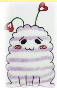
琴浦中学校区人権啓発 マスコット「ふわふわちゃん」