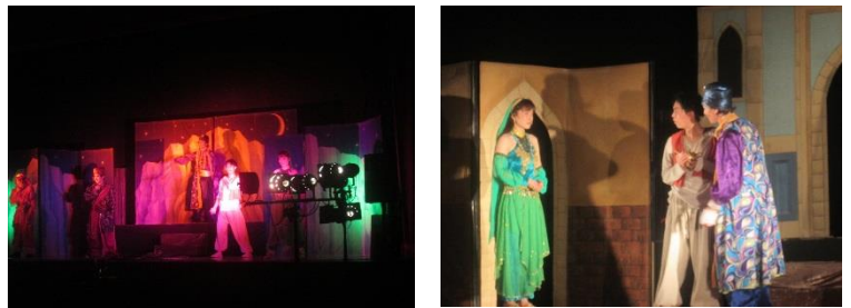
劇「アラジンと魔法のランプ」の一場面

9月26日(水)劇団 歌舞人(かぶと)による「アラジンと魔法のランプ」を全校で鑑賞しました。子ども達にとっては、とてもなじみのある大好きなお話でした。笑いあり、感動ありの内容で80分の劇がとても短く感じられました。7人の劇団員の方々の演技がすばらしく、心が引き付けられる魅力がありました。