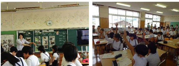
6年1組 家庭科の授業の様子