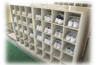
かかとをそろえて整頓された靴箱

ことをしっかりとほめました。また、保護者の方から「家でも話を聴くことができるようになりました。」「家でもくつをそろえるようになりました。」の声をいただき、保護者の方のご協力に感謝しております。2学期以降も続けてほしいと思っております。