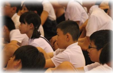
真剣に話を聴く子どもたち

7月19日(木)1学期の終業式を行いました。いつも本校の教育活動に対しまして温かいご支援・ご協力をいただきまして心より感謝いたします。また、この度の西日本豪雨の大規模災害では、被災された皆様に心よりお見舞い申し上げます。