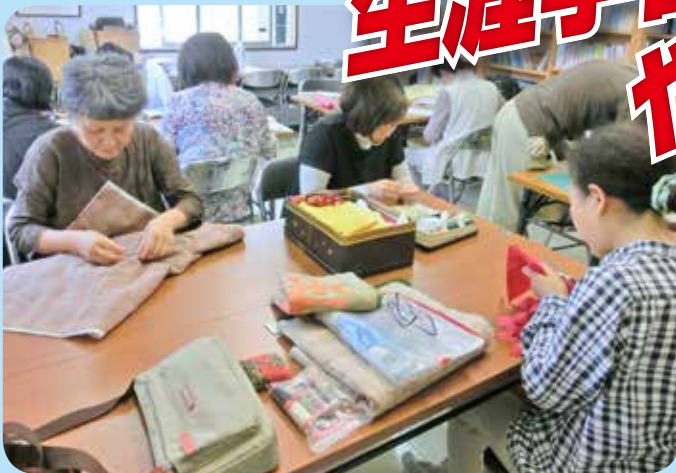
布で楽しく表現パッチワーク 下津井公民館