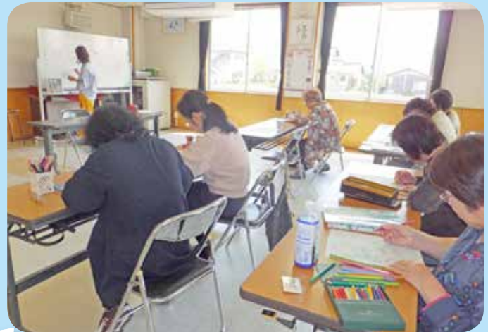
大人のぬり絵 福田公民館