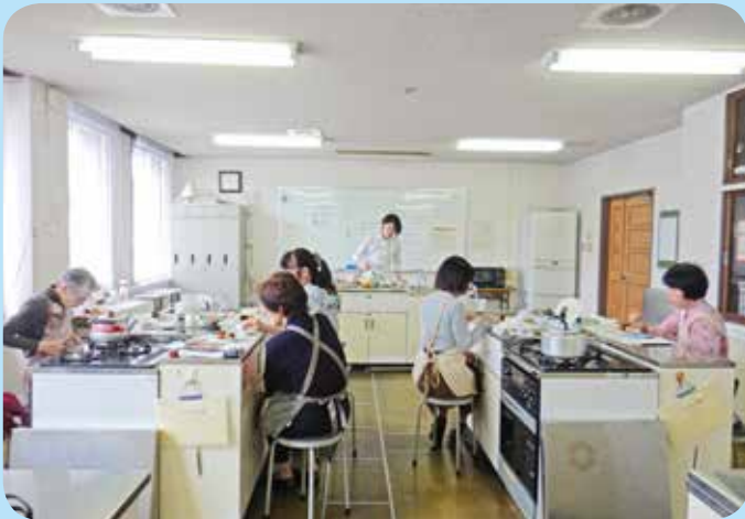
紅茶教室～お菓子をそえてティータイム～ 倉敷北公民館

発行 倉敷市生涯学習推進本部 編集 倉敷市教育委員会 ライフパーク倉敷市民学習センター TEL(086)454-0011 FAX(086)454-0305