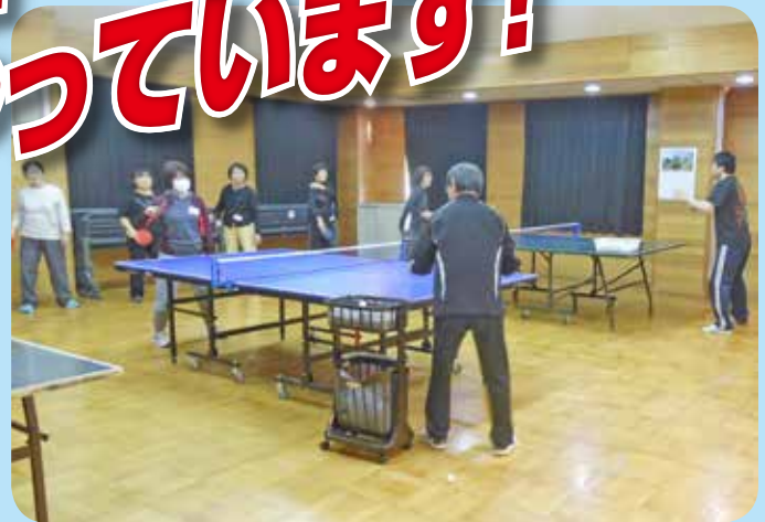
卓球教室 玉島西公民館