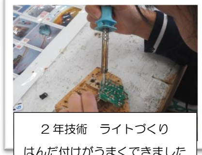
2年技術 ライトづくり はんだ付けがうまくできました