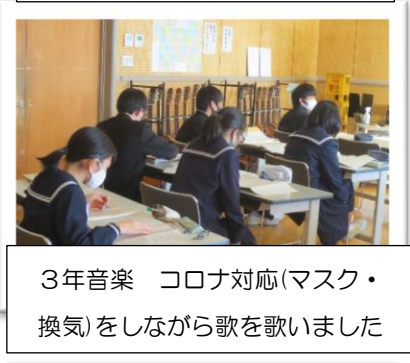
3年音楽 コロナ対応(マスク・ 換気)をしながら歌を歌いました