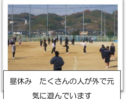
昼休み たくさんの人が外で元気に遊んでいます