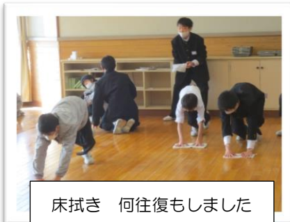
床拭き 何往復もしました