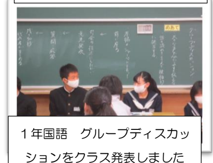
1年国語 グループディスカッションをクラス発表しました