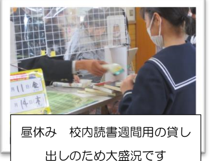
昼休み 校内読書週間用の貸し出しのため大盛況です