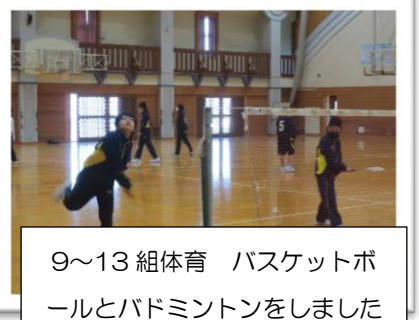
9~13組体育 バスケットボールとバドミントンをしました