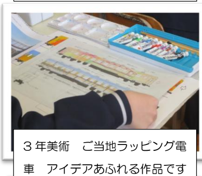
3年美術 ご当地ラッピング電車 アイデアあふれる作品です