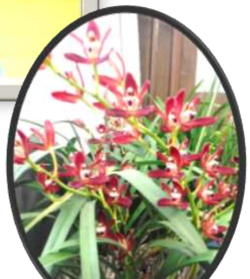
校長室 ～シンビジウム～