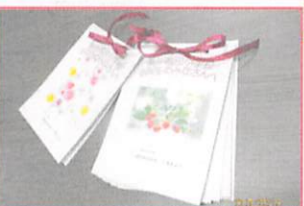
新入生のみなさんへの手紙