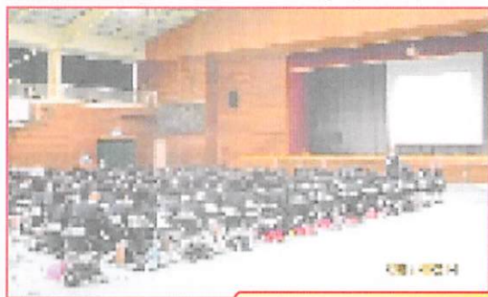
小学生の代表児童へ手紙の贈呈