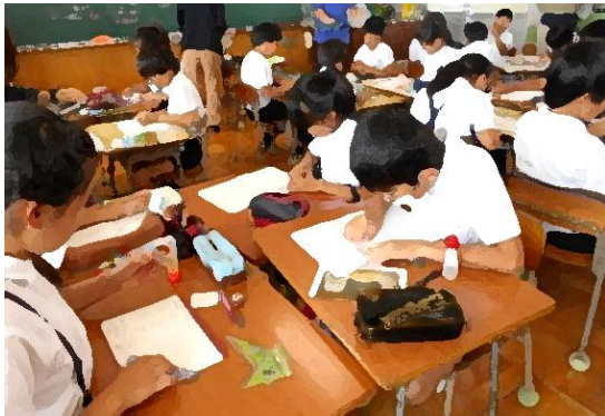
『算数科の授業の様子（4年生）』

前回の校長室便りで、委員会活動や清掃活動などで活躍している子どもたちの様子を紹介しました。今回は学習の場面でがんばっている子どもたちを紹介します。