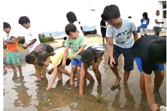
『総合的な学習の時間 田植えの様子（5年生）』

自分たちで運営の仕方を工夫し、田植えの会をしました。秋の収穫に向けて毎日の観察や世話をがんばっています。