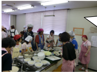
大樹とのふれあい交流会

福祉作業所の方と一緒に素麺と野菜炒めを作りました。食後は大きな声で歌を歌いました