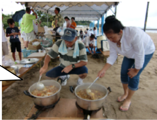
沙美国際親子ふれあいキャンプ

イギリスや中国など外国の方々とカレーを作ったり地引き網をしたりして楽しく過ごしました