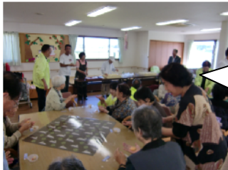
高齢者とのふれあい交流会

デイサービスセンターの高齢者の方と和菓子を作ったり、懐かしの歌を歌ったりして交流を深めました