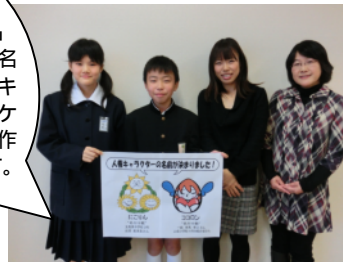
人権キャラクター名付け親の皆さん

401件の応募の中から、「にこりん」「ココロン」という名前に決定しました。キャラクター入りのポケットティッシュを製作し、配布しています。