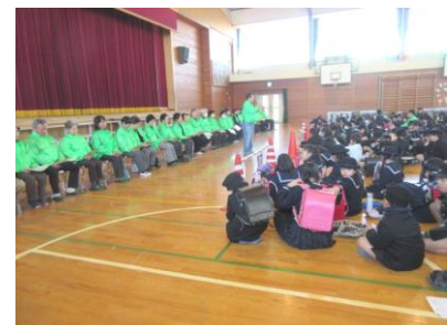
上：代表の方のごあいさつ