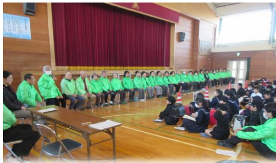
安全パトロール隊様

子どもたちからは、感謝の寄せ書きと6年生からの手紙を贈りました。人に思いを伝える喜び、自分がしたことで相手の方が喜ぶ姿を目にする喜び、子どもたちは、そのようなことも感じたにちがいありません。地区ごとに整列した子どもたちの態度もよく、穏やかな雰囲気の中で会を終えることができました。事故に合わなかったことは決して当たり前ではなく、子どもたち自身の努力とこうした地域の方のおかげであると改めて感じました。安全パトロール隊の皆様、本当にありがとうございました。