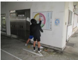
給食場のこんだて表記入，コーン並べ給食に向けて，朝から活動開始です。