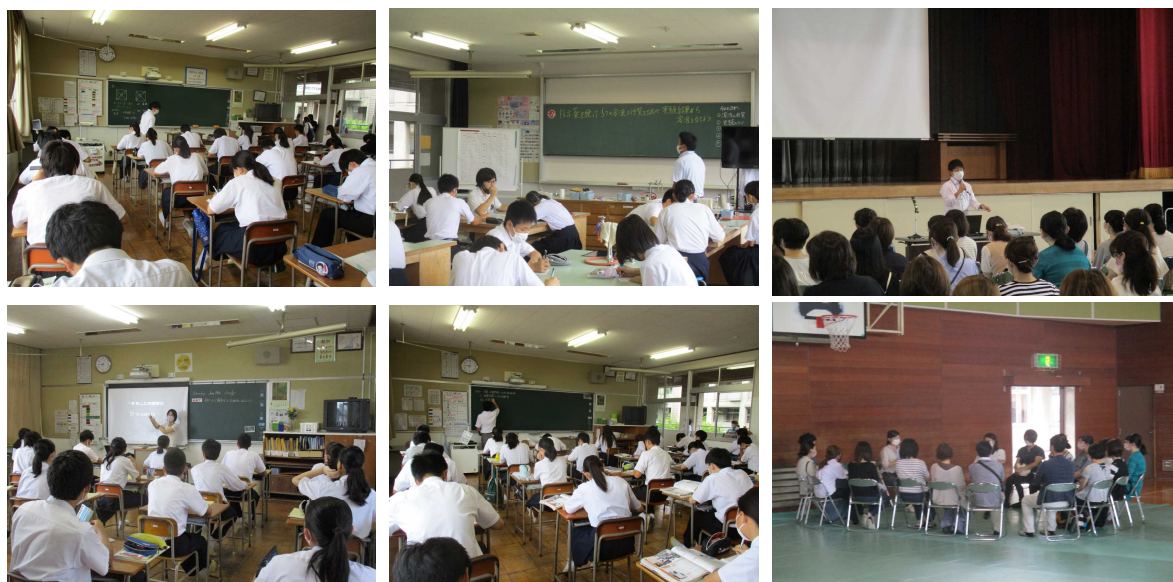
お忙しい中、多くの保護者の方にご参観いただきました。ありがとうございました。