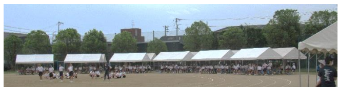
トラックに沿っていっぱいのテント