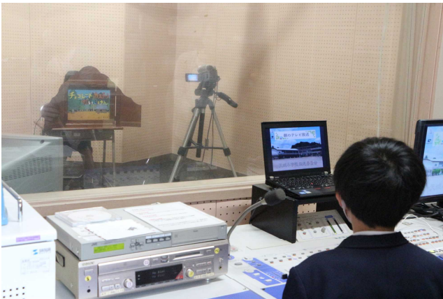
スタジオから生放送中

今朝はそのチャレンジタイムの時間を使って、図書委員会による読み聞かせの活動が行われました。委員会の担当の児童は、事前に練習を重ねて、上手に紙芝居を読むことができました。全校の教室からは、物音一つ聞こえず、みんなテレビに釘付けでした。